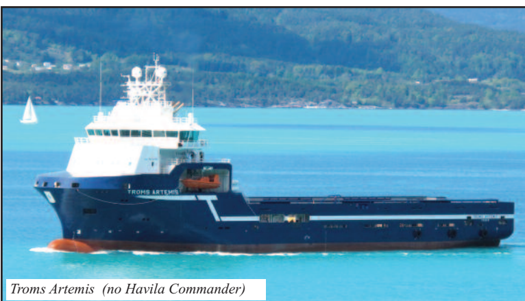
Troms Artemis (no Havila Commander)

Hellesøy Verft AS har samarbeid med dei same folka heile tida, men det har skjedd store endringar undervegs på reiarlagssida.